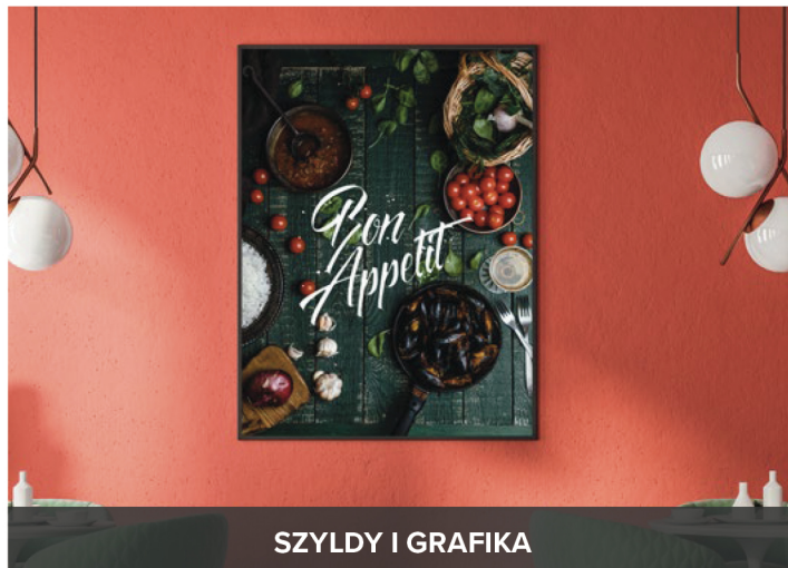
SZYLDY I GRAFIKA