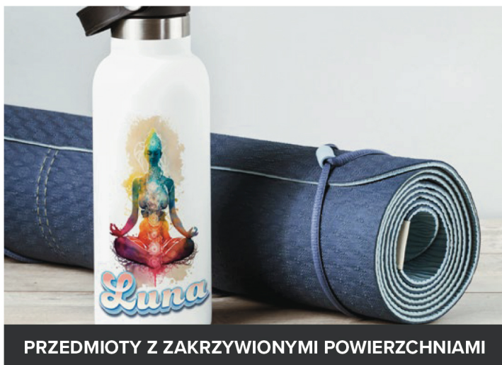
PRZEDMIOTY Z ZAKRZYWIONYMI POWIERZCHNIAMI