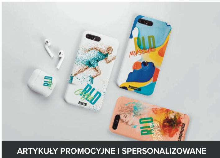
ARTYKUŁY PROMOCYJNE I SPERSONALIZOWANE